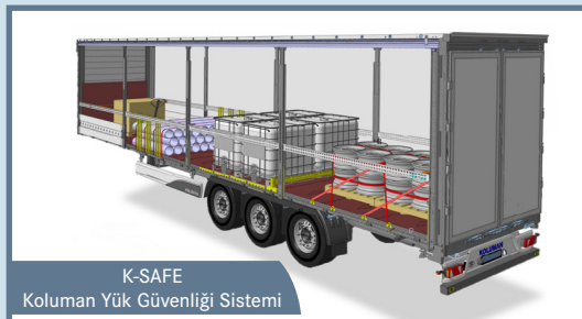
K-SAFE Koluman Yük Güvenliği Sistemi